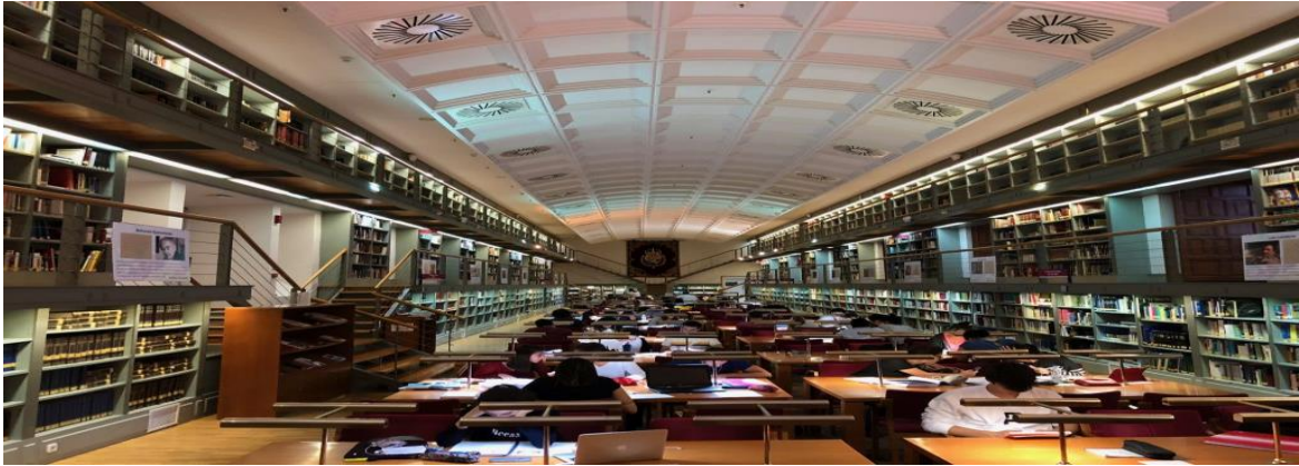
Sala de lectura de la Biblioteca de Castilla-La Mancha en el Alcázar

Exercise 1: - Escribe un texto admirativo sobre el Alcázar de Toledo, rellenando los espacios con la expresión correcta: recomendable, maravilloso, impresionante, inolvidable, incomparable.