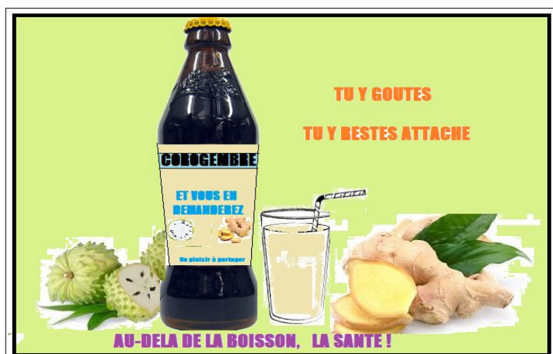
Exemple de réalisation du conditionnement primaire du produit « COROGEMBRE »