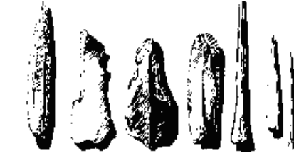
Couteau. Burins. Raclour. Pointes en os.